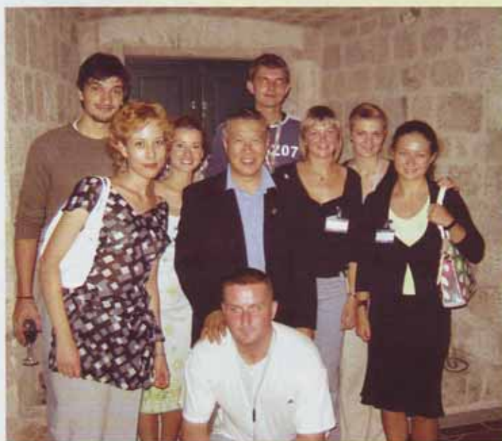
Interes mladih istraživača bio je velik