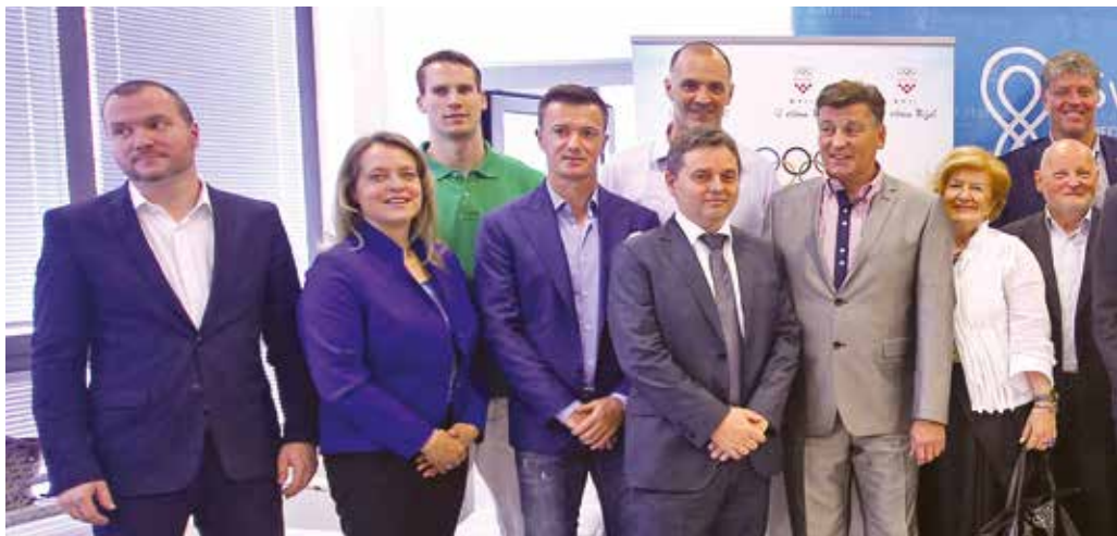
Prije godinu dana Specijalna bolnica za ortopediju, kirurgiju, neurologiju postala je službena bolnica Hrvatskog olimpijskog odbora

Ukidanje pozicije znanstvenog novaka također je bila greška. Mi te mlade ljude moramo vezati za Hrvatsku. I nema kompromisa. Moraju biti vezani uz najbolje mentore. Oni su suho zlato. Nema budžeta koji smije biti ograničavajući za te mlade ljude, oni su voljni boriti se i ostati dok im ne prekipi, a onda prolaze situacije koje ostavljaju