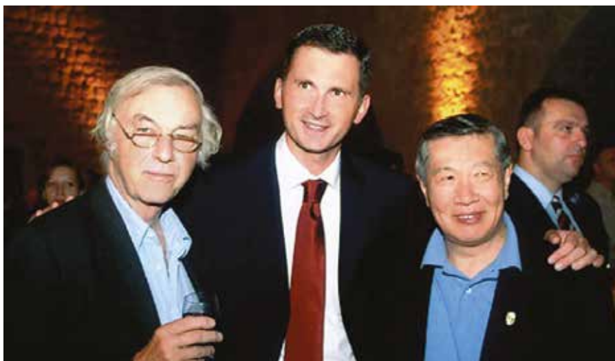
Dragan Primorac u društvu Nobelovca prof. dr. Roberta Hubera i prof. dr. Henry Leeja

brojnih drugih država. U ovom djelu Europe daleko smo najbolji i jedino se Austrija može uspoređivati s nama. O vrijednosti tog rezultata svjedoči još jedan pokazatelj: od 20 vodećih država svijeta iz skupine G-20, koje čine 85 posto ukupnog svjetskog bruto nacionalnog proizvoda, 80 posto svjetske trgovine i dvije trećine svjetske populacije, Hrvatska je prema kvaliteti obrazovanja bolja od njih 12.