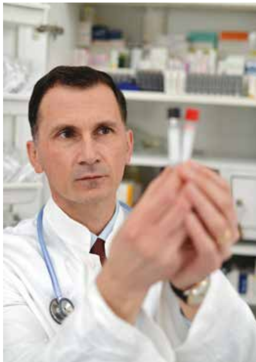
Personalizirana medicina je temeljno načelo kojim se vodi bolnica Sv. Katarina, ali i prof. dr. sc. Dragan Primorac osobno

U radu kongresa sudjelovat će šezdesetak pozvanih predavača koji dolaze s Harvard School of Medicine, Mayo Clinic, The Technion – Israel Institute of Technology, University of Cambridge, Duke University, University of New Haven, National Institutes of Health-NIH, Max Planck instituta, Thomas Jefferson University, Weizmann Institute of Science, George Washington University, Penn State University, Cleveland Clinic te 500-tinjak sudionika, iz više od 40 država svijeta. Posebno me veseli što će među sudionicima biti i brojni hrvatski znanstvenici te niz studenata iz Hrvatske i inozemstva.