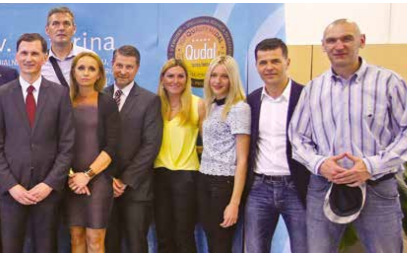
i fizikalnu medicinu i rehabilitaciju Sv. Katarina

nih stanica, točnije biološki aktivnog skafolda (bioaspirata) dobivenog iz masnog tkiva sa svrhom liječenja bolesti hrskavičnog tkiva.